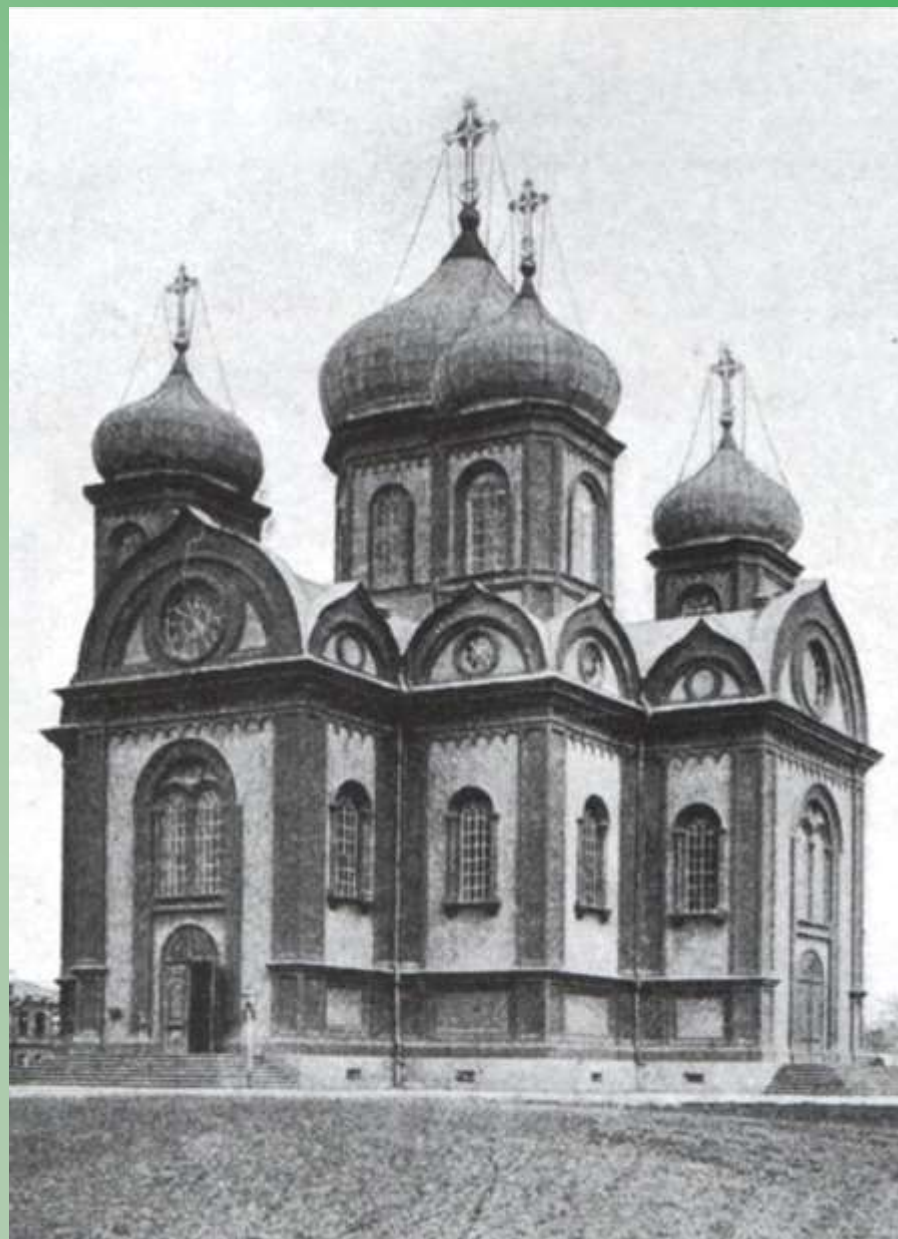
Войсковой Собор Св. Блг. кн. Александра Невского г. Екатерининдар